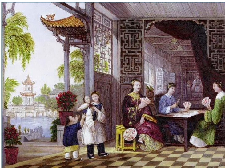
Семья китайского мандарина в средние века

содержать. Многоженство было характерно для высших и средних слоёв общества. Такое же явление, как моногамия, являлось нормой для всего остального небогатого и бедного китайского населения.